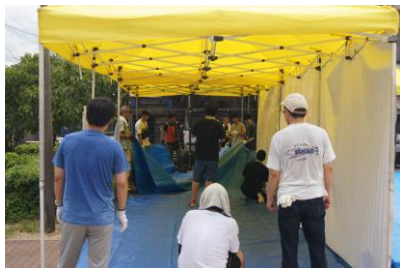
テント設営の様子