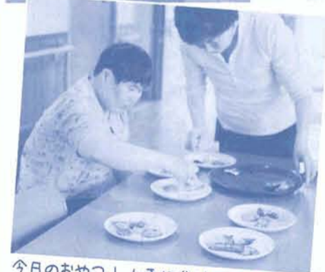
今日のおやつ! 上手に分けています

を経て障害の重い仲間たち十八名のケアホーム「ドリームハウス」での生活がスタートしました。期待も不安もたくさん抱えながら夢がいっぱいつまったみんなのいえでの生活。散歩やお料理に挑戦する仲間たち。楽しみながら、のびのびとした姿で自立(律)への一歩を踏み出しました。