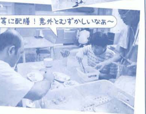
均等に配膳! 意外とみずがしいなあ~