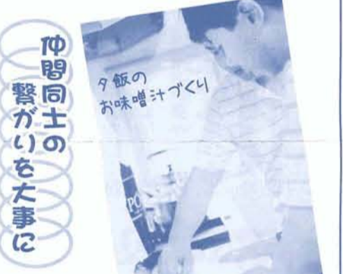
夕飯のお味噌汁づくり

このことから仲間同士の繋がりを大事にしながら、職員も仲間たちと力を合わせてみんなのドリームハウスを作って行けたらいいなあと感じます。(橋本)