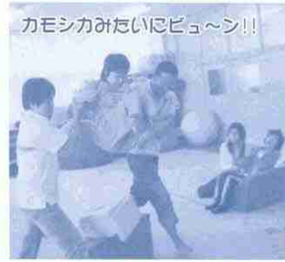
カモシカみたいビュ〜ン!!

人類がこの地球上に誕生した 時から「ヒト」はことばよりも まず踊ることで、体を動かすこ とで喜びや悲しみ、怒り、驚き を表現したことでしよう。でも 特に私たち日本人は人前で自由 に踊るなんてなれていないので はずかしくてその気持ちはあつ てもなかなかハジメノダイツ ボが出ませんよね。ところが「の びのび」の仲間はちがうんです。