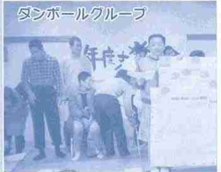
ダンボールグループ

定額と定額できた平利1シヤツ第三弾。なななんと！約二〇〇枚も売れちゃいました。平和記念館での販売により、飛躍的にアップ！世界の人々の胸にはもみじの仲間が描いたドームの絵が！