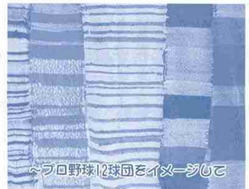
フワ野球|2球団をイメージして