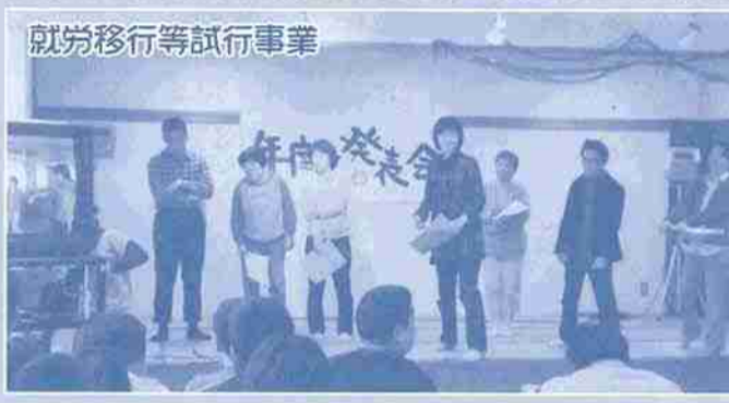
就労移行等試行事業

続いては元気いっぱいダンス ボールグループです。 仲間の希望で他の作業所にダ ンボールの仕事の見学に行つて きました。作業の早さにビック リ！ 刺激を受けて力が入った 一年。来年度の目標はスピード アップ！ で給料アップ！？ 声をかけ合いながら今年度も 一年チームワークを大切にしてい がんばります！