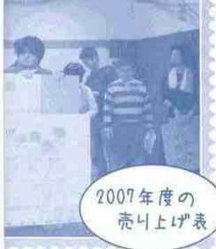
2007年度の 売り上げ表

地域販売ミニミニバザールで は豆乳プリンやみかんゼリーな ど毎回いろいろな商品を仕入れ ました。品数アップとともに、 売上もアップ！ もみじオリジナルTシャツの