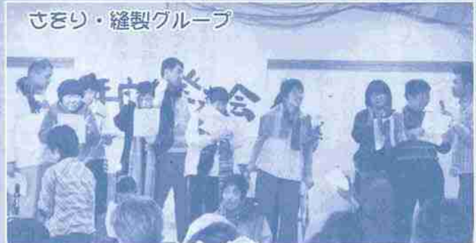
さそり・縫製グループ

がらっと雰囲気が変わりほんわかムードのさをり・縫製グループです。 色とりどりのさをりのストーリーで華やかに演出！一人一人の「がんばった」を仲間みんなで評価しあう。「みんなで作ったよ」の感じが伝わってきます。 プロ野球12球団をイメージして織ったさをり織りも登場。さをり織りで応援グッズも作れそうですね。