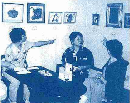
「あの絵すてきね〜」しばし、くつろぎ。