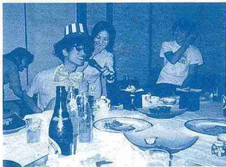
夜の交流会、おもしろかったヨ

はじめに、きょうされん全国事務局の方がきょうされんについて自分の体験を交えながら具体的に話をされました。その中